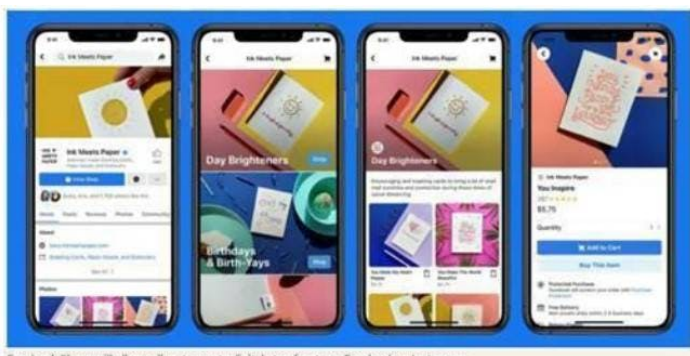
Facebook Shops will allow sellers to create digital storefronts on Facebook or Instagram

“Facebook Shops” consentirà ai venditori di creare vetrine digitali su Facebook o Instagram.