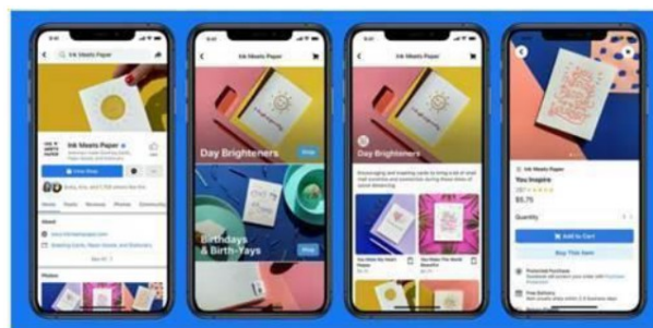
Facebook Shops will allow sellers to create digital storefronts on Facebook or Instagram

“Facebook Shops” consentirà ai venditori di creare vetrine digitali su Facebook o Instagram.