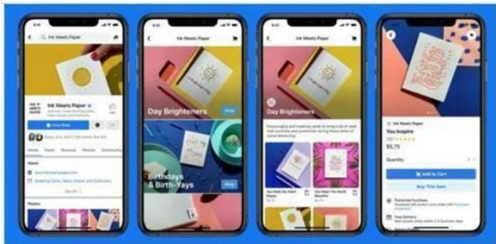
Facebook Shops will allow sellers to create digital storefronts on Facebook or Instagram

Avec Facebook Shops, les commerçants pourront créer leur boutique virtuelle sur Facebook ou Instagram.