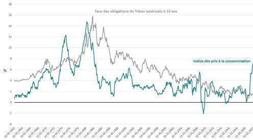
Evolution des taux à 10 ans et de l'inflation aux Etats-Unis

La seconde conséquence du comeback de l'inflation est que pour respecter leur mandat, les banques centrales peuvent être amenées à retirer de la liquidité alors même qu'un ralentissement se profile ou se développe. Et selon toute vraisemblance, ce serait ce vers quoi l'on tend aux Etats-Unis aujourd'hui et, peut-être, en Europe demain.