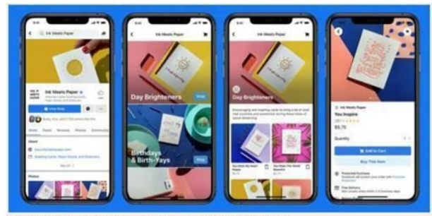
Facebook Shops will allow sellers to create digital storefronts on Facebook or Instagram

„Facebook Shops“ ermöglichen jedem Verkäufer die Werbung über digitale Schaufenster auf Facebook oder Instagram.