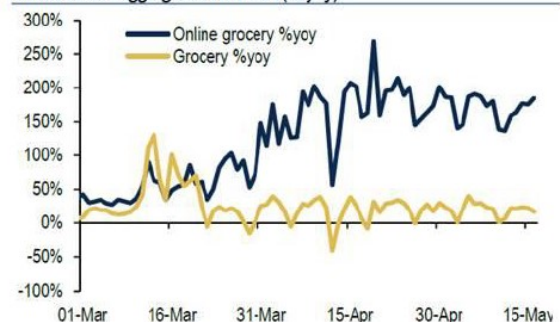
Chart 11: Daily online spending at groceries vs. all spending at groceries, based on BAC aggregated card data (% yoy)

Die großen Veränderungen fanden im Online-Einkauf von Lebensmitteln statt. Amazon ist der große Gewinner dieser Entwicklung! Selbst alteingesessene Lebensmitteleinzelhändler in den Vereinigten Staaten wie der Marktführer Walmart konnten den Online-Umsatz von 5,9% im Vorjahr auf