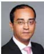
L. Ducoin Gestore

Un Fondo prettamente paneuropeo, 100% stock-picking