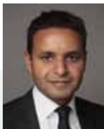
S. Essafri Gestore

Carmignac Grande Europe è un fondo che investe nei paesi membri dell'Unione Europea (minimo 75% del patrimonio), nelle economie emergenti dell'Europa dell'Est e a titolo complementare in Russia e Turchia. Carmignac Grande Europe è un comparto della Sicav lussemburghese Carmignac Portfolio.