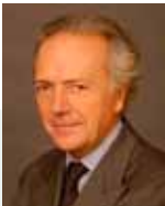
E. Carmignac Gérant

Une gestion internationale de conviction reconnue qui vise à maximiser la performance